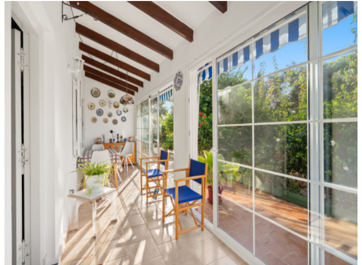
Jardín de invierno