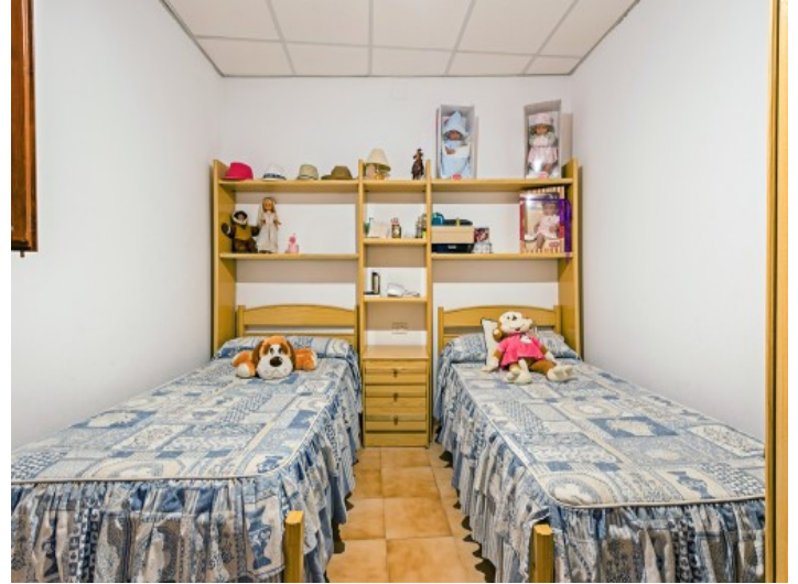
Uno de 7 dormitorios