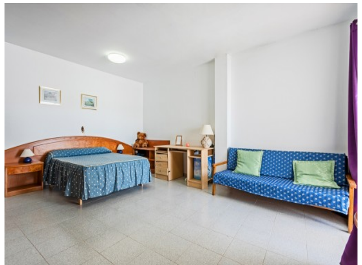
Uno de 7 dormitorios

Toda la información como mejor se puede saber, salvo por error durante el periodo de venta. Sirva este documento como un informe previo, las bases legales solo serán válidas a través de un contrato de compra acordado ante Notario.