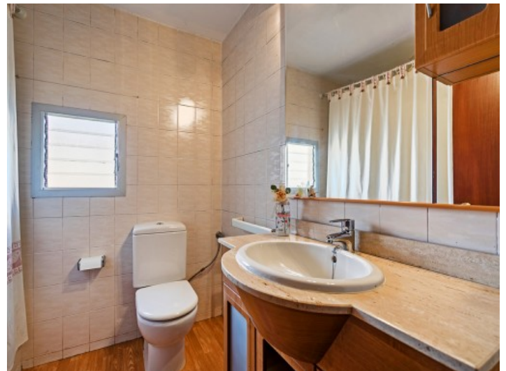
Uno de 2 baños