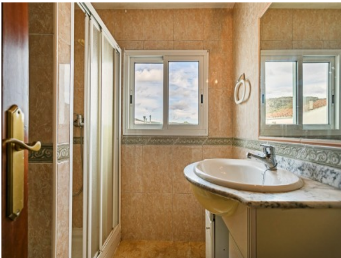
Uno de 2 baños