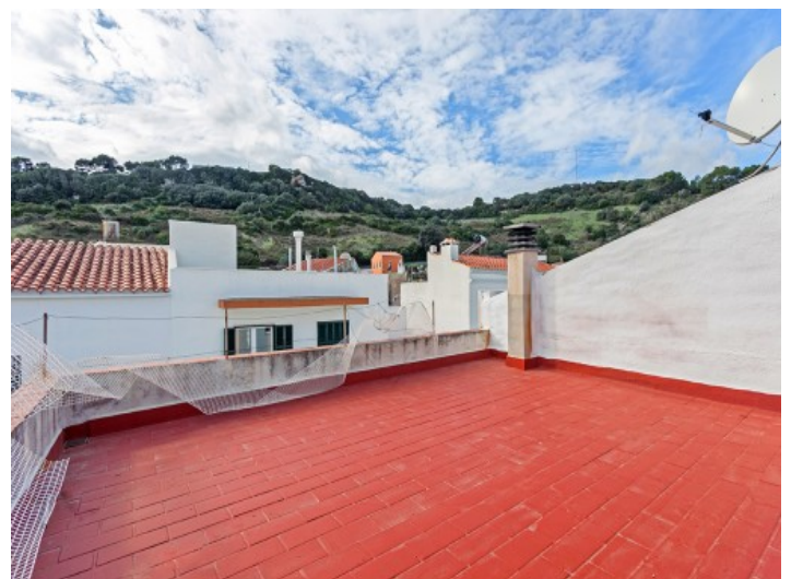
Terraza con vistas al pueblo

Toda la información como mejor se puede saber, salvo por error durante el periodo de venta. Sirva este documento como un informe previo, las bases legales solo serán válidas a través de un contrato de compra acordado ante Notario.