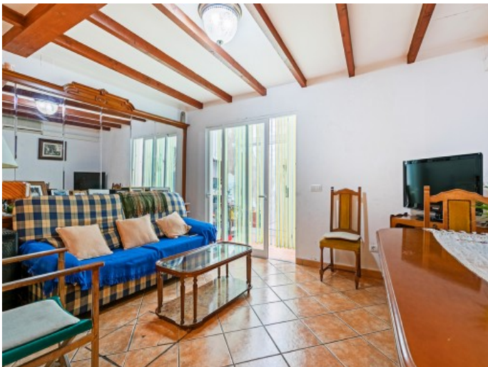
Salón-comedor con acceso al patio