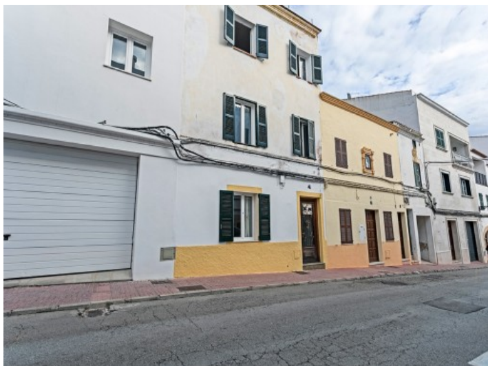
Vista frontal de la casa