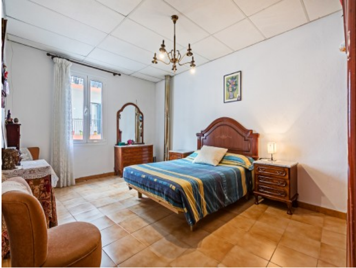
Uno de 7 dormitorios