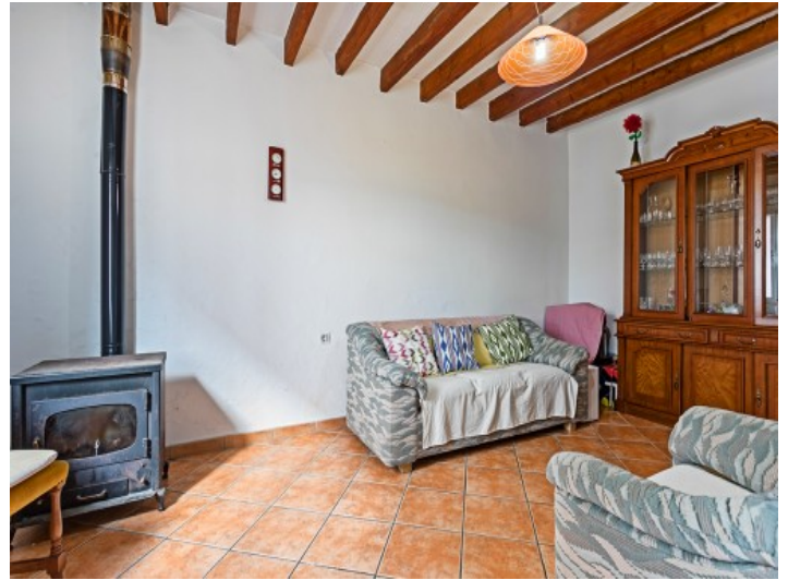
Salón con chimenea