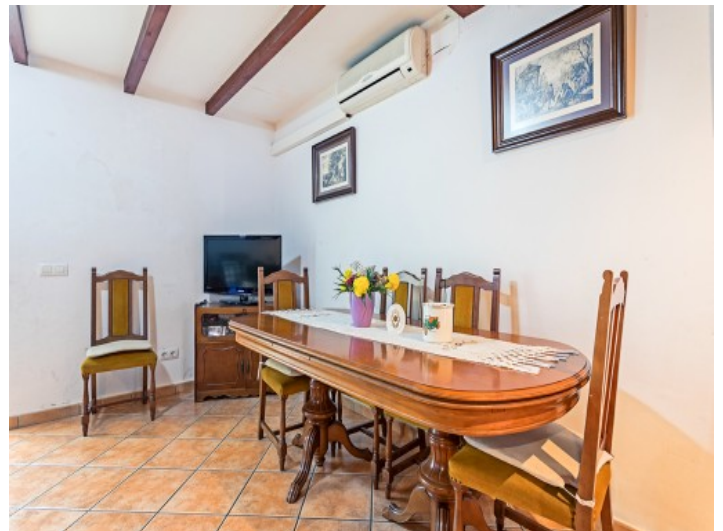
Vista de comedor