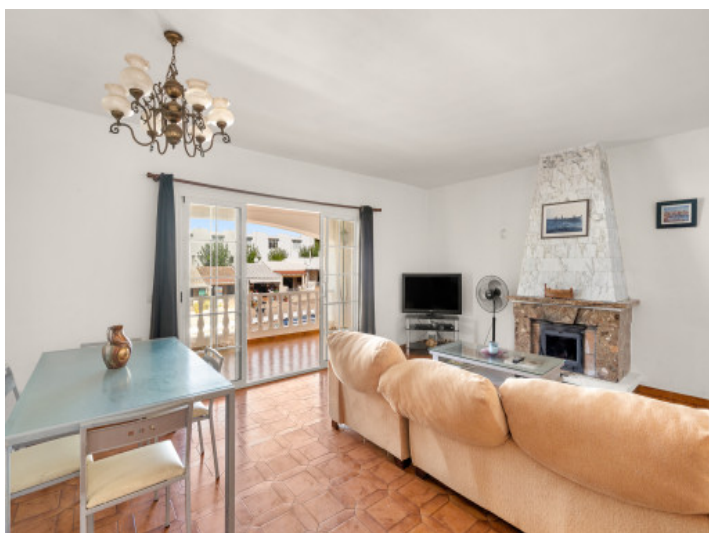
Acceso a la terraza