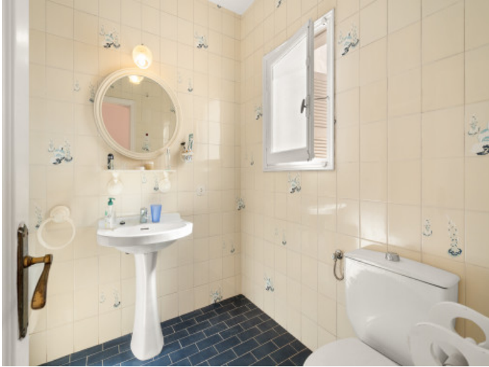
Uno de 3 baños