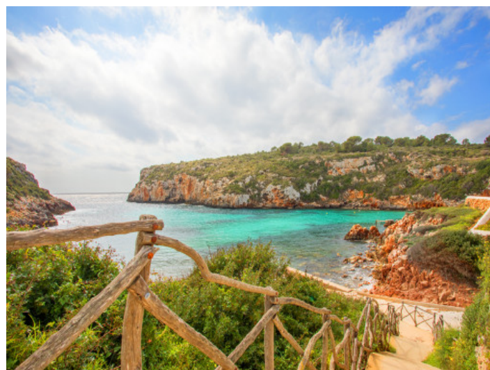
Acceso al mar