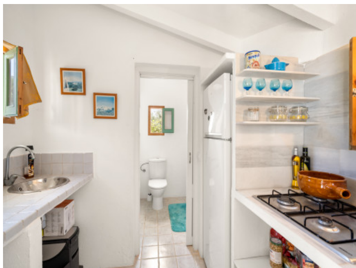
Cocina y baño