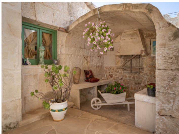
Horno de leña