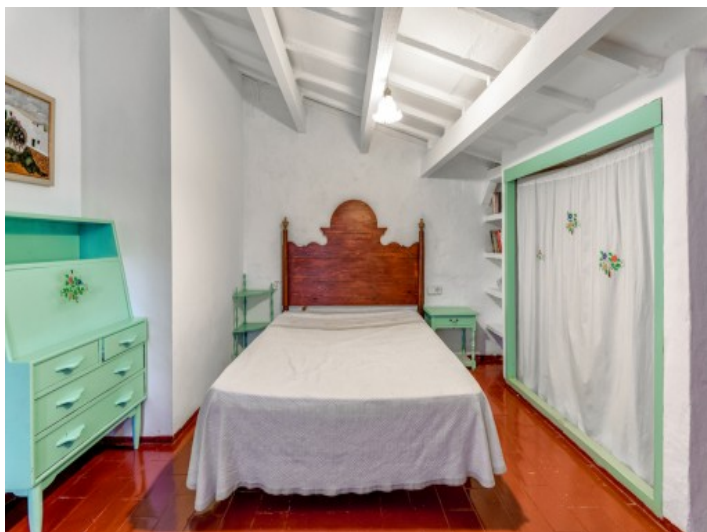
Segundo dormitorio con armario empotrado