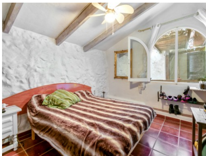
Dormitorio de la casa de huéspedes