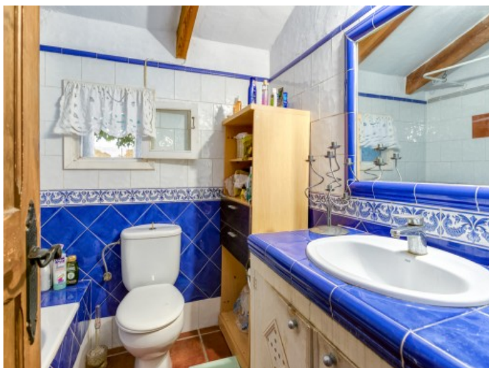
Baño de la casa de huéspedes