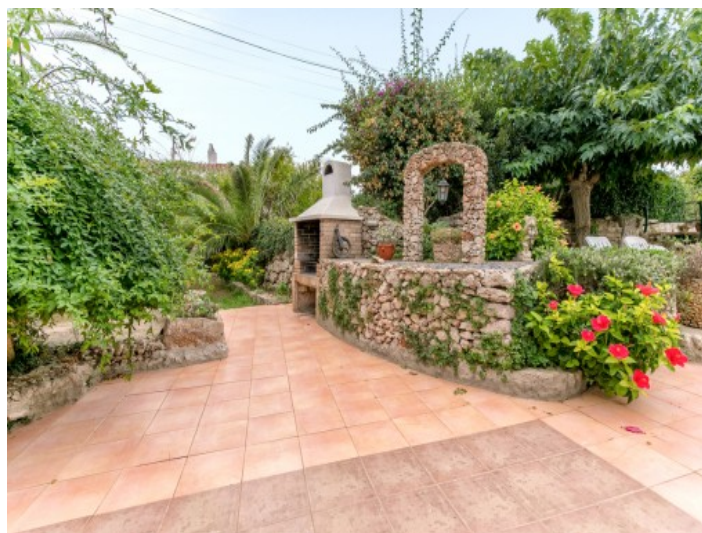
Jardín bien equipado

Toda la información como mejor se puede saber, salvo por error durante el periodo de venta. Sirva este documento como un informe previo, las bases legales solo serán válidas a través de un contrato de compra acordado ante Notario.