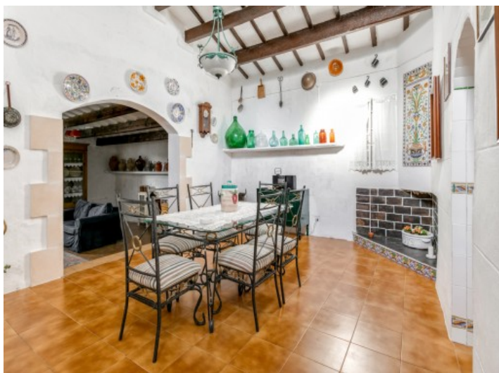
Comedor del chalet