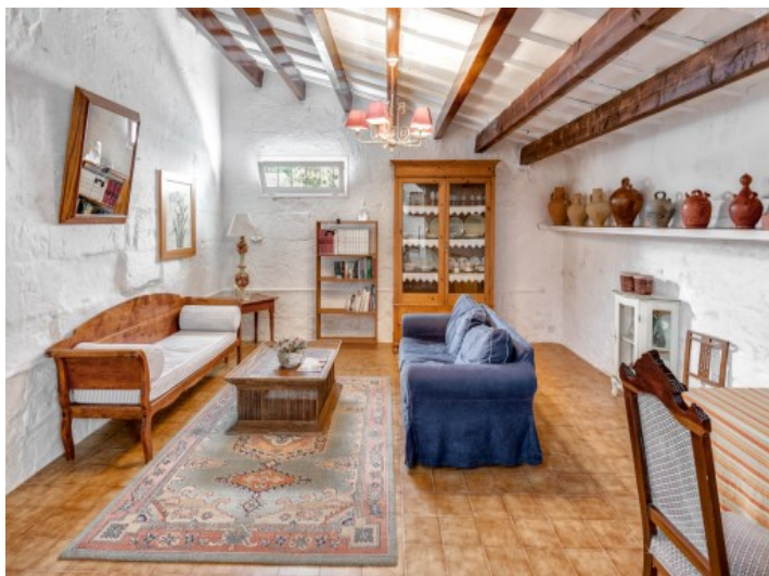
Vista alternativa de la sala de estar