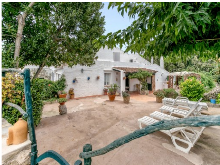
Vistas exteriores del chalet