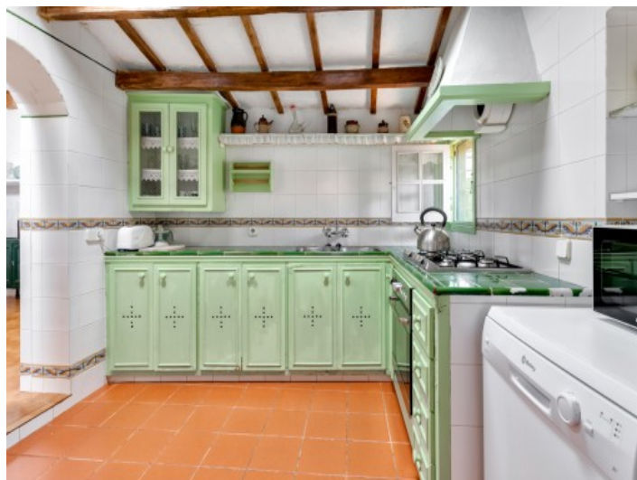
Rústica cocina totalmente equipada