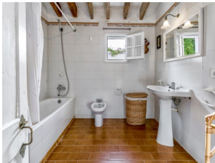
Baño inunado por luz natural