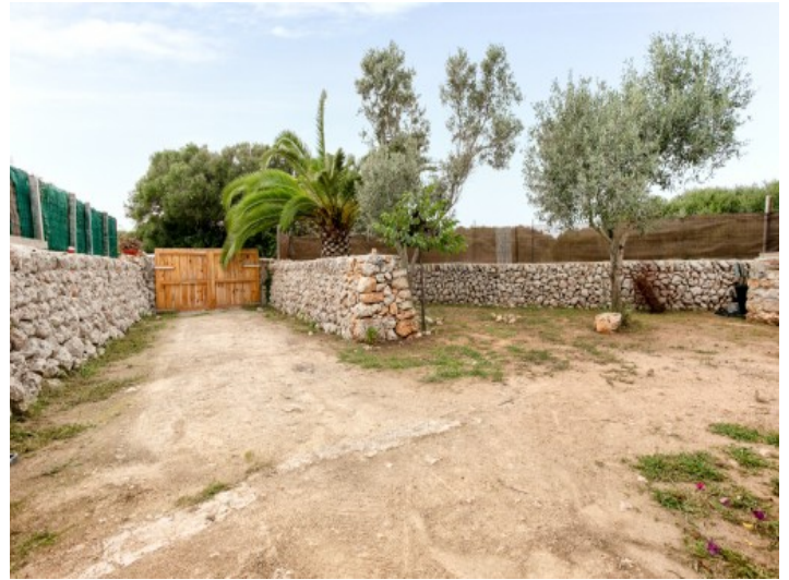
Jardín grande y la entrada