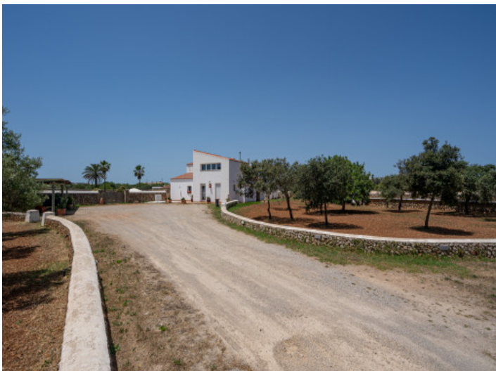
Acceso a la finca