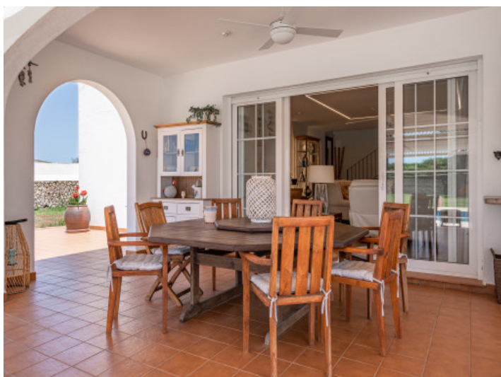
Terraza cubierta con comedor