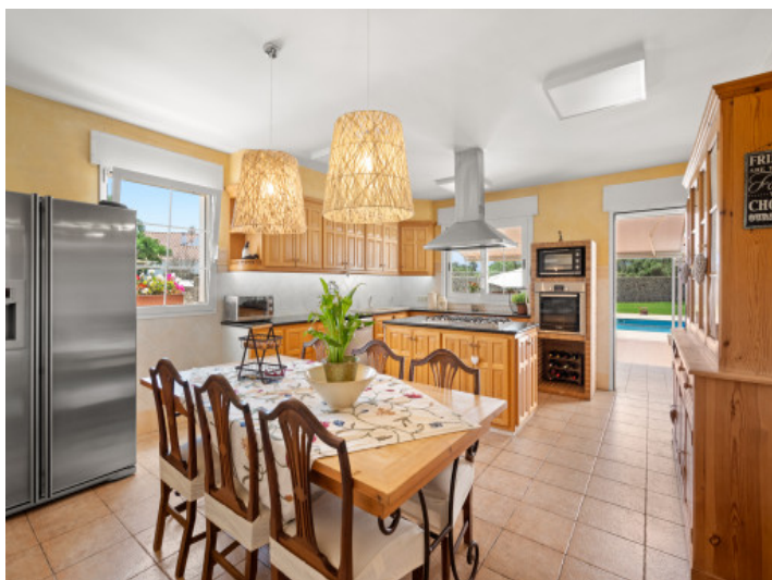
Comedor y cocina abierta