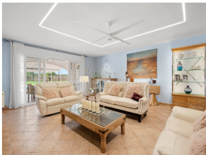
Salón lleno de luz