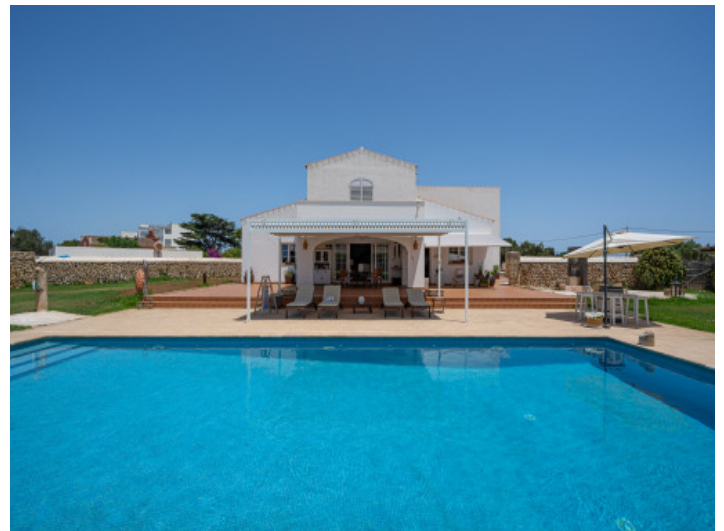
Piscina grande y terraza