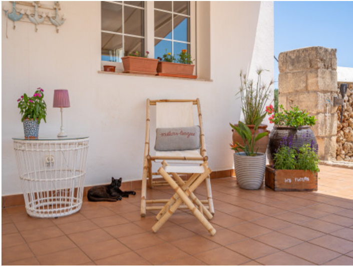
Terraza con encanto