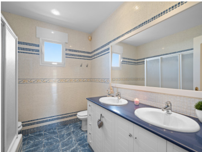
Uno de 3 baños