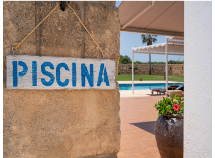
Acceso a la piscina