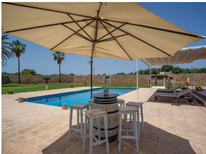
Área de piscina diseñado de buen gusto