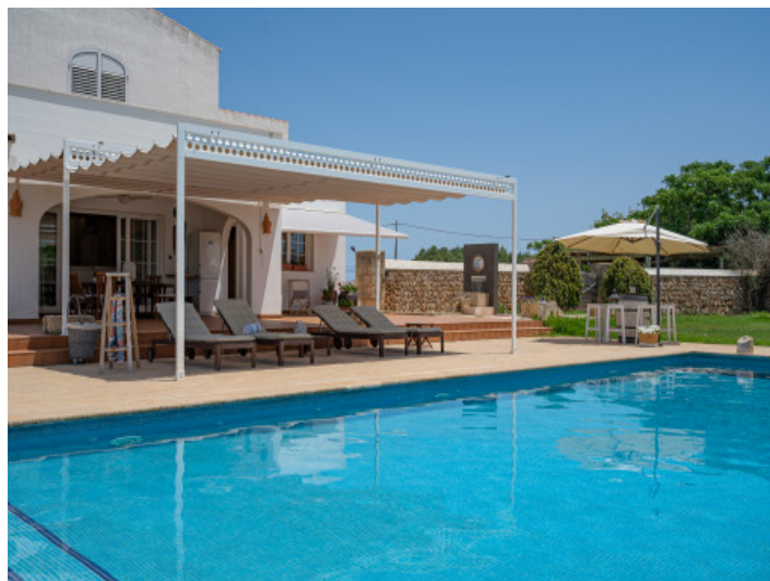
Piscina grande con terraza