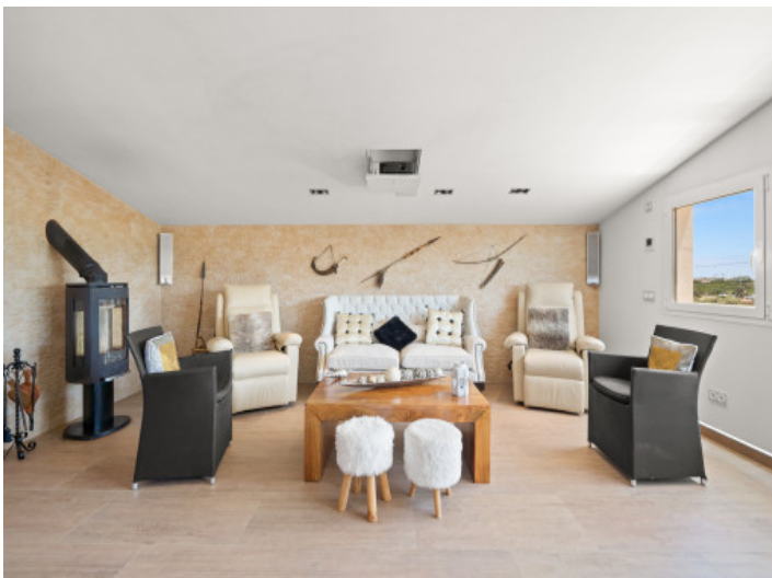
Área de estar