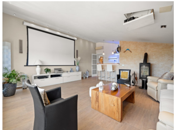
Cinema con bar en la planta superior