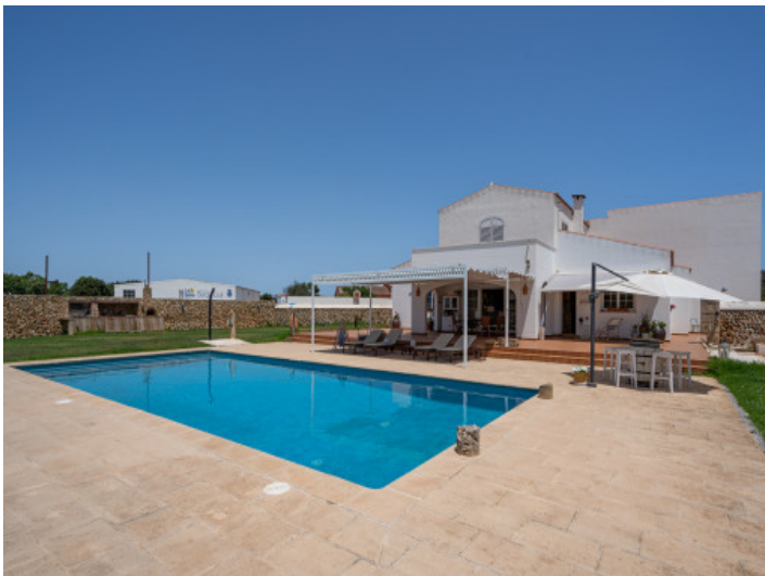
Finca y área de piscina