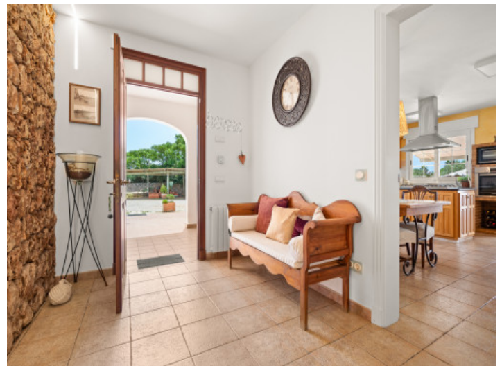
Entrada a la finca

Toda la información como mejor se puede saber, salvo por error durante el periodo de venta. Sirva este documento como un informe previo, las bases legales solo serán válidas a través de un contrato de compra acordado ante Notario.