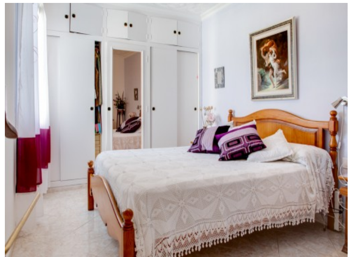
Segundo dormitorio con baño en suite

Toda la información como mejor se puede saber, salvo por error durante el periodo de venta. Sirva este documento como un informe previo, las bases legales solo serán válidas a través de un contrato de compra acordado ante Notario.