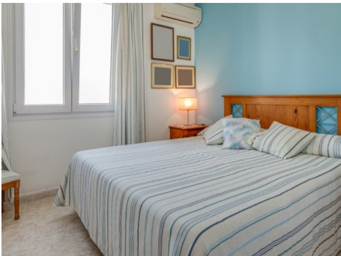
Uno de 4 dormitorios bonitos