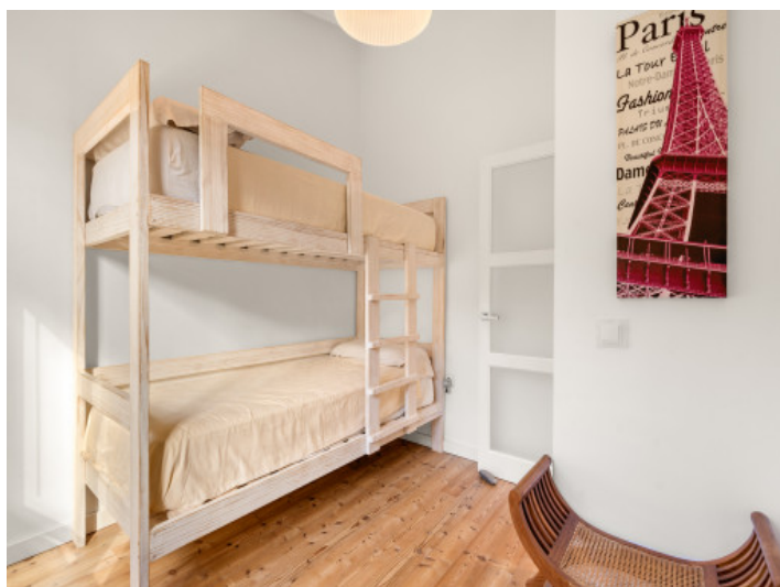
Cuarto de los niños